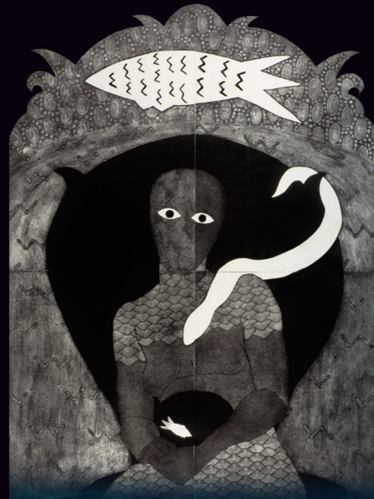
ARTISTA: Belkis Ayón. "Sikán" 1991

El programa (versión adaptada) rinde homenaje a una leyenda carabalí (región de Calabar, sur de Nigeria), de donde partieron miles de esclavos en los siglos XVIII y XIX.